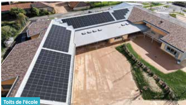
Toits de l'école