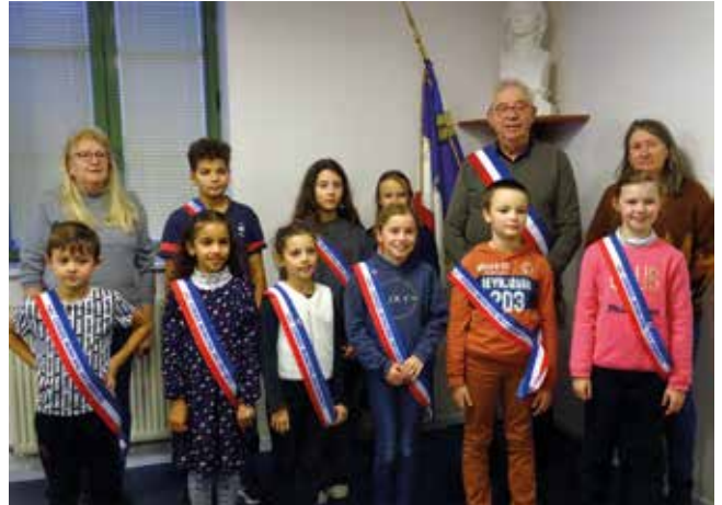
De gauche à droite

La première réunion de ce nouveau conseil a eu lieu le 8 décembre, réunion lors de laquelle la sacoche du « parfait conseiller enfant » leur a été remise, avec bien sûr l'écharpe tricolore qui permet d'être visible lors des cérémonies.