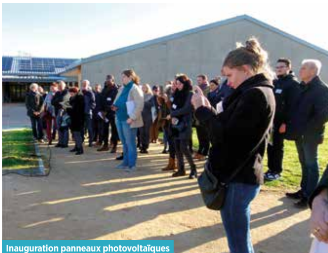
Inauguration panneaux photovoltaïques