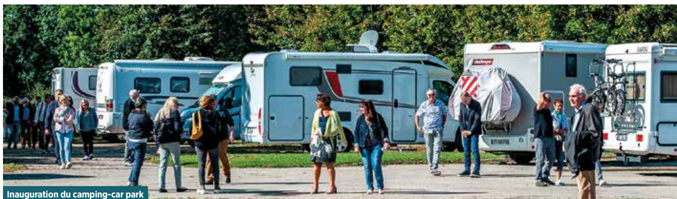
Inauguration du camping-car park

Il était une fois un lopin de terre situé à la sortie ouest de Mézériat, entre Bassol et le centre bourg. Longtemps lieu d'habitation collective, il connut les joies du quotidien des locataires. Beaucoup de mézériati(e)s sont né(e)s, ont vécu ou ont été de passage dans un de ces logements. Puis, vint le temps de la démolition. La zone resta délaissée et déserte durant plusieurs décennies.