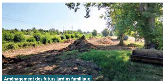
Aménagement des futurs jardins familiaux

Le site de La Féole connaît enfin une seconde vie.