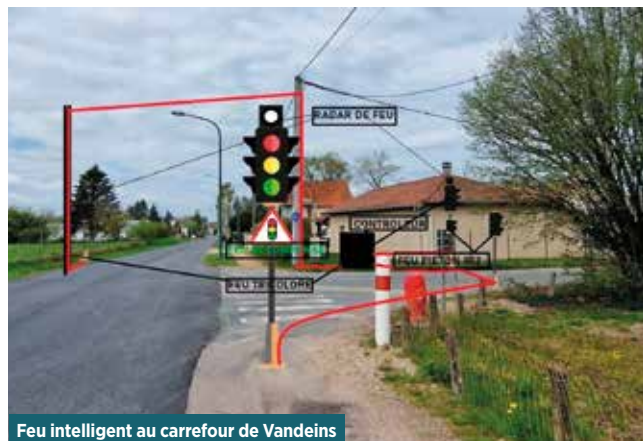
Feu intelligent au carrefour de Vandeins

Tous ces travaux doivent être réalisés cette année. Nous sommes actuellement dans l'attente des accords nécessaires pour ces réalisations et de l'aboutissement des demandes de financements de l'état.