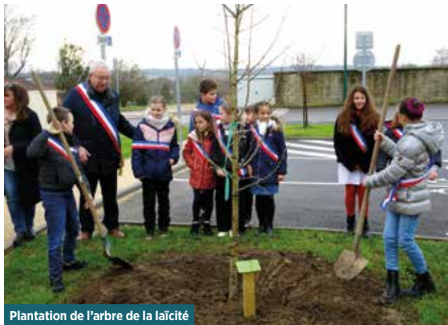
Plantation de l'arbre de la laïcité

À l'intérieur de l'école, sous les préaux, seront également disposées des poubelles, en accord avec les couleurs des façades, pour les petits déchets des enfants.