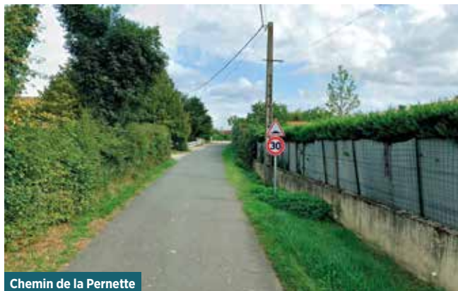
Chemin de la Pernette

Un cheminement doux (piétons et cyclistes) est envisagé sur un ancien chemin existant reliant le hameau des Dalles jusqu'au chemin de la Pernette