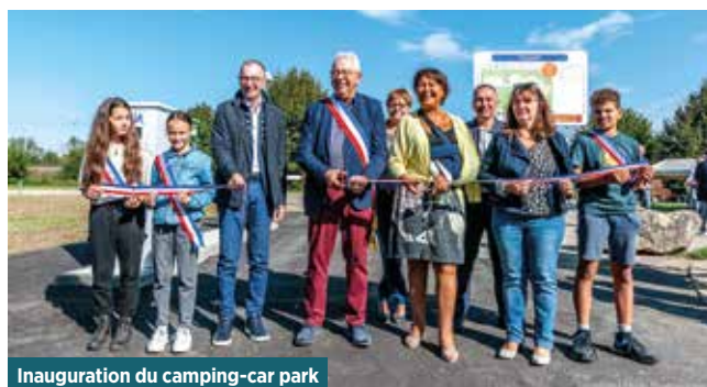
Inauguration du camping-car park