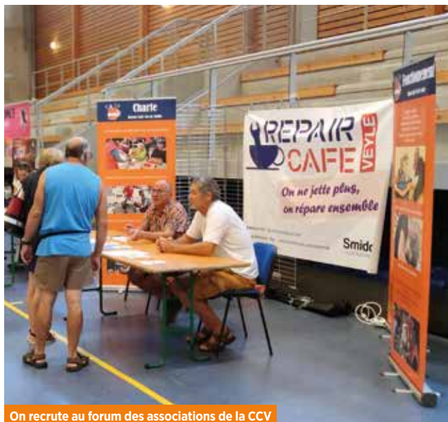
On recrute au forum des associations de la CCV

En effet, en plus d'être un lieu de réparation en tout genre, le Repair Café est également un lieu de convivialité.