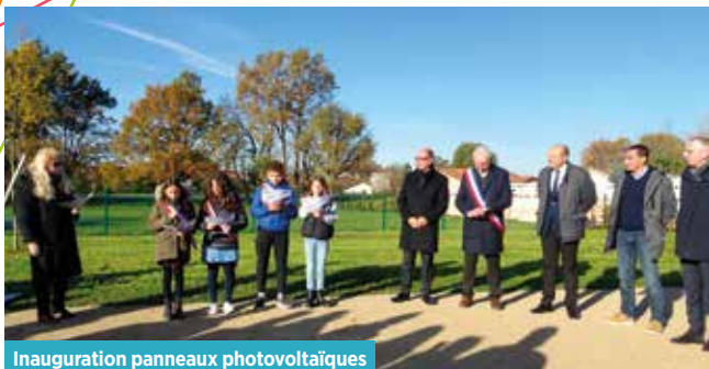
Inauguration panneaux photovoltaïques