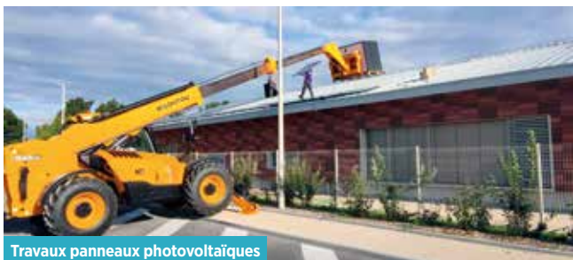
Travaux panneaux photovoltaïques