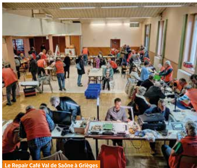
Le Repair Café Val de Saône à Grièges