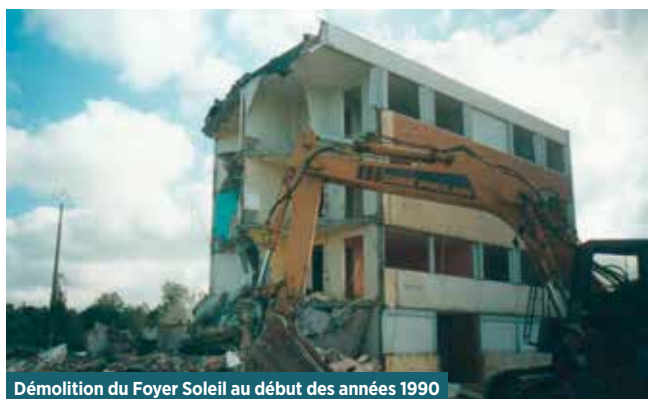
Démolition du Foyer Soleil au début des années 1990

Il était une fois un lopin de terre situé à la sortie ouest de Mézériat, entre Bassol et le centre bourg. Longtemps lieu d'habitation collective, il connut les joies du quotidien des locataires. Beaucoup de mézériati(e)s sont né(e)s, ont vécu ou ont été de passage dans un de ces logements. Puis, vint le temps de la démolition. La zone resta délaissée et déserte durant plusieurs décennies.