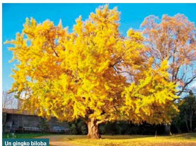
Un gingko biloba

*Rappelons que les DDEN ont des tâches multiples au sein de l'éducation nationale, ils participent aux commissions chargées de décider de la création ou de la fermeture de classe, ils sont membres de droit lors des conseils d'école. Le président national collabore avec le ministre de l'éducation nationale.