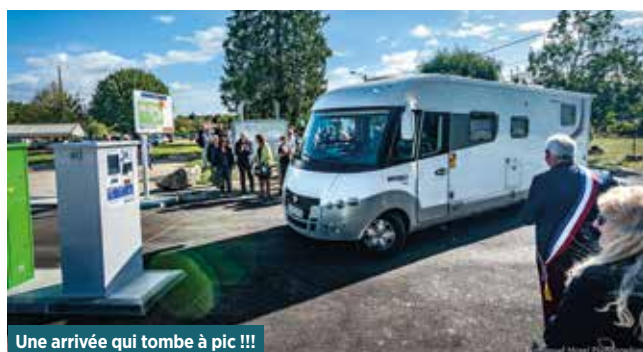
Une arrivée qui tombe à pic !!!